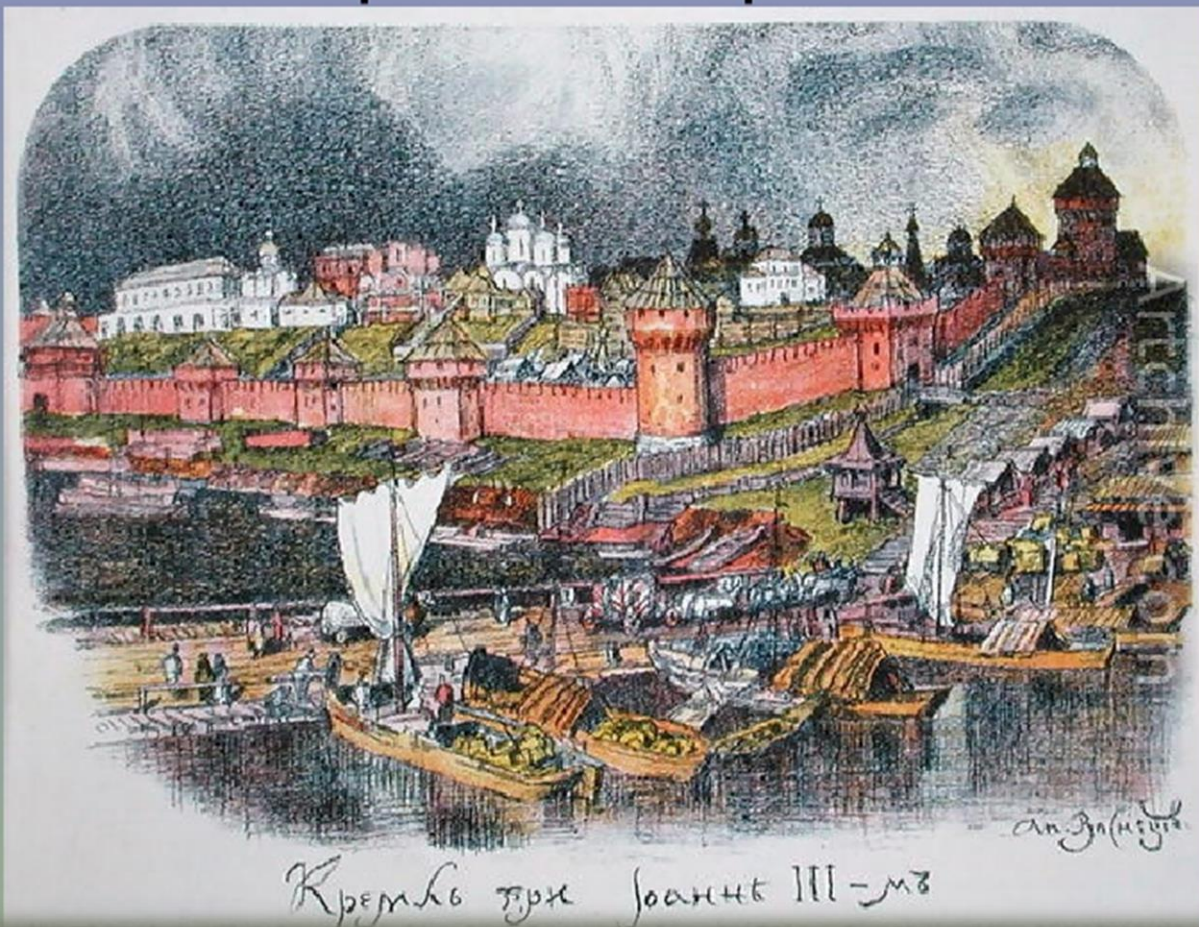
Кремль при Иоанне III-м