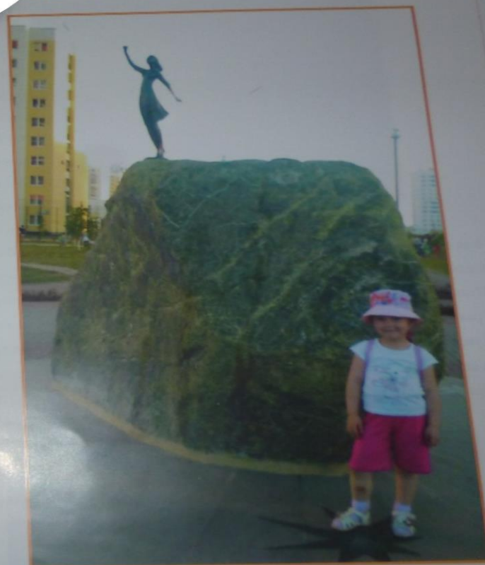
Символ нашего микрорайона

Компьютерная верстка: И.А. Денисова, М.Н. Хотенова