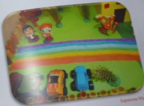
Баранова Машиа, 5 лет