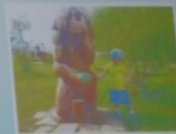
Рязанов Арсений, 3 года

Район растёт и крепнет, А вместе с ним и я. Как здорово, что вместе живём мы здесь, друзья!